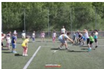
2017-05-29-Dzień Dziecka na sportowo na rabczańskim Orliku