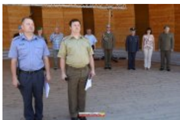
2017-05-28-II Mundurowy Dzień Dziecka