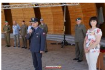
2017-05-28-II Mundurowy Dzień Dziecka