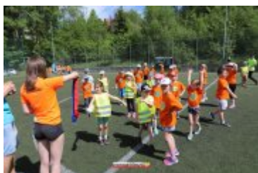
2017-05-29-Dzień Dziecka na sportowo na rabczańskim Orliku