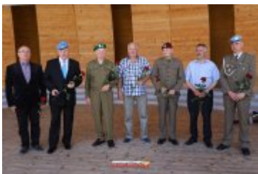
• 2017-05-28-II Mundurowy Dzień Dziecka