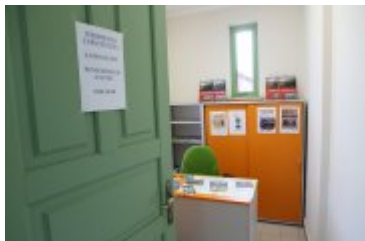
Punkt Informacji Turystycznej