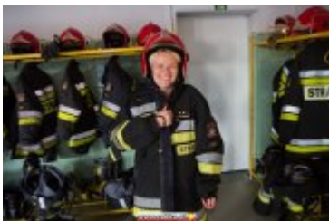
• 2016-09-20-Konferencja Thematical Network