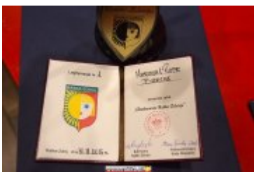
OSOBOWOŚĆ RABKI-ZDROJU - GALA W KINIE ŚNIEŻKA