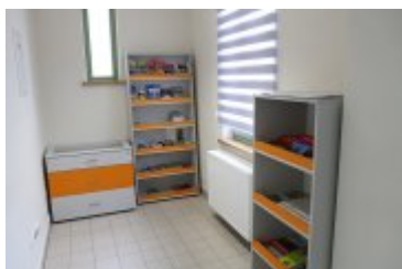
Punkt Informacji Turystycznej