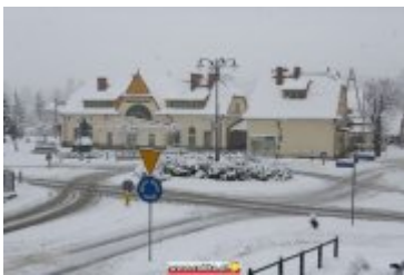
ZIMOWA SCENERIA W UZDROWISKU