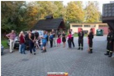
• 2016-09-20-Konferencja Thematical Network