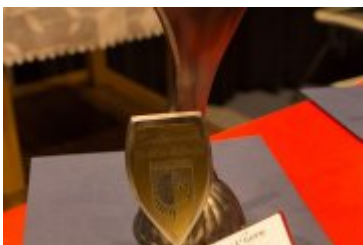
OSOBOWOŚĆ RABKI-ZDROJU - GALA W KINIE ŚNIEŻKA