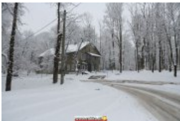
ZIMOWA SCENERIA W UZDROWISKU