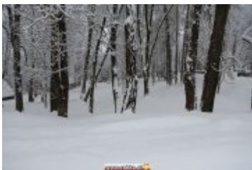
ZIMOWA SCENERIA W UZDROWISKU