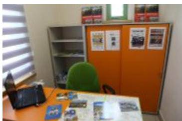
Punkt Informacji Turystycznej