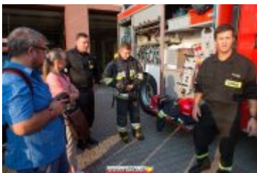
• 2016-09-20-Konferencja Thematical Network