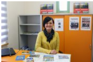
Punkt Informacji Turystycznej