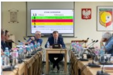
• 2024-05-28-III Sesja Rady Miejskiej w Rabce-Zdroju