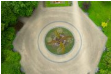
• 2024-05-29-Rabczański Park Zdrojowy pełen tysięcy kwiatów!