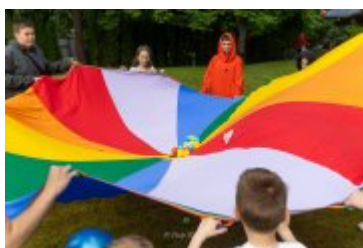
• 2024-06-03- Dzień Dziecka w Rabce-Zdroju cz.2