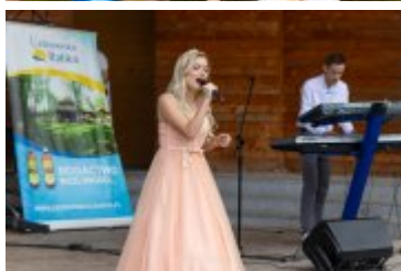
• 2024-06-03- Dzień Dziecka w Rabce-Zdroju cz.2