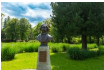
• 2024-05-29-Rabczański Park Zdrojowy pełen tysięcy kwiatów!