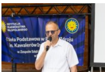
• 2024-06-03- Dzień Dziecka w Rabce-Zdroju cz.2