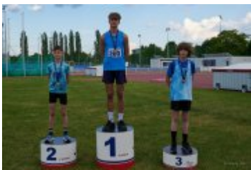
• 2024-05-27-Mistrzostwa Małopolski w dwubojach